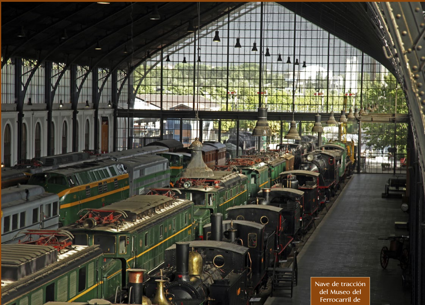
Nave de tracción del Museo del Ferrocarril de Madrid.