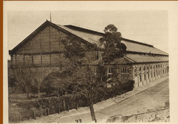
ESTACION DE LAS DELICIAS (Madrid).

El escaso éxito empresarial de las sucesivas compañías ferroviarias que explotaron esta línea hacia la frontera portuguesa, debido en parte a la despoblación y pobreza de la zona por la que discurría, culminó en 1928 con su nacionalización, junto con otras líneas, integradas