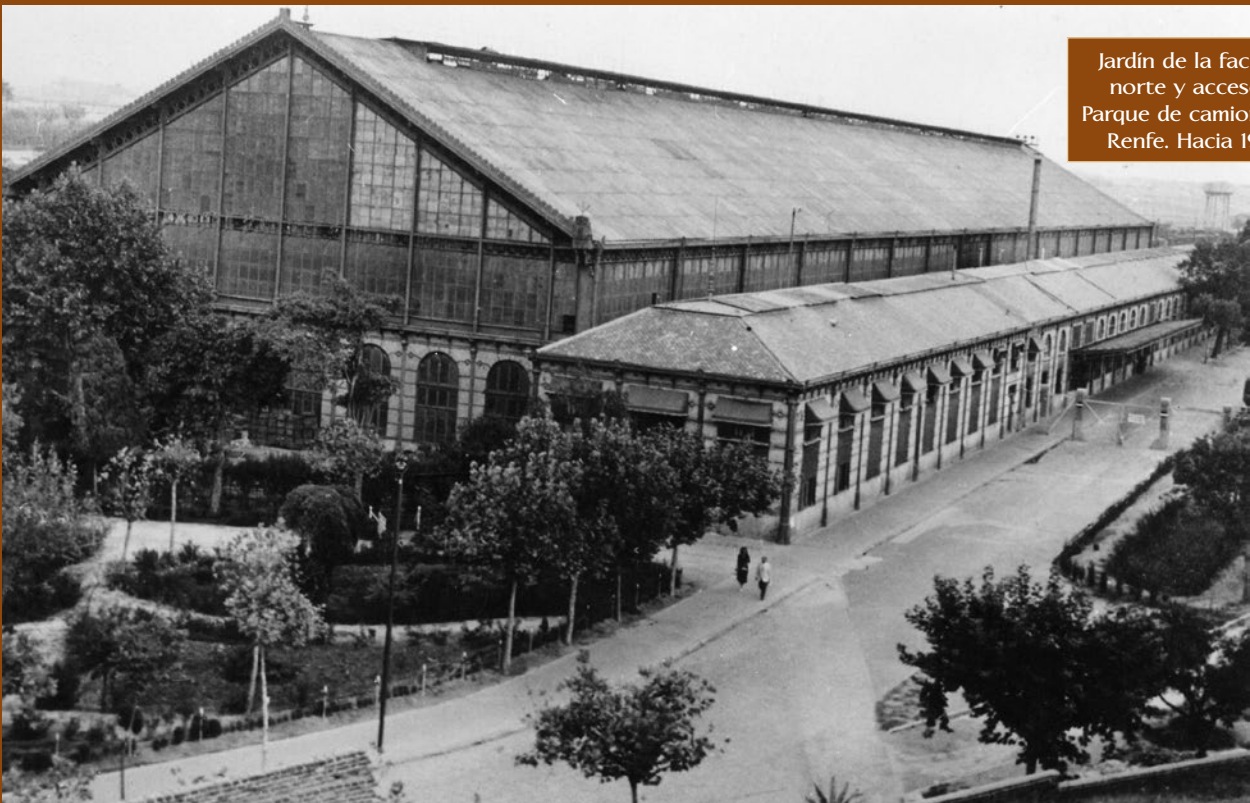
Jardín de la fachada norte y acceso al Parque de camiones de Renfe. Hacia 1949.

licias, impulsaron ampliaciones y reformas en todo el recinto. El vestíbulo, hasta entonces diáfano, fue dividido para ubicar oficinas en la primera planta y los archivos en la segunda. Tam-