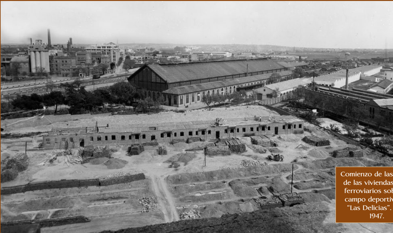
Comienzo de las obras de las viviendas para ferroviarios sobre el campo deportivo de "Las Delicias". Año 1947.

en la Compañía Nacional de los Ferrocarriles del Oeste de España.