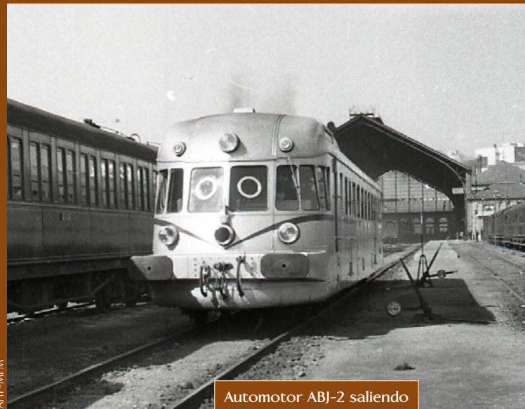
Automotor ABJ-2 saliendo de Delicias. Año 1960.