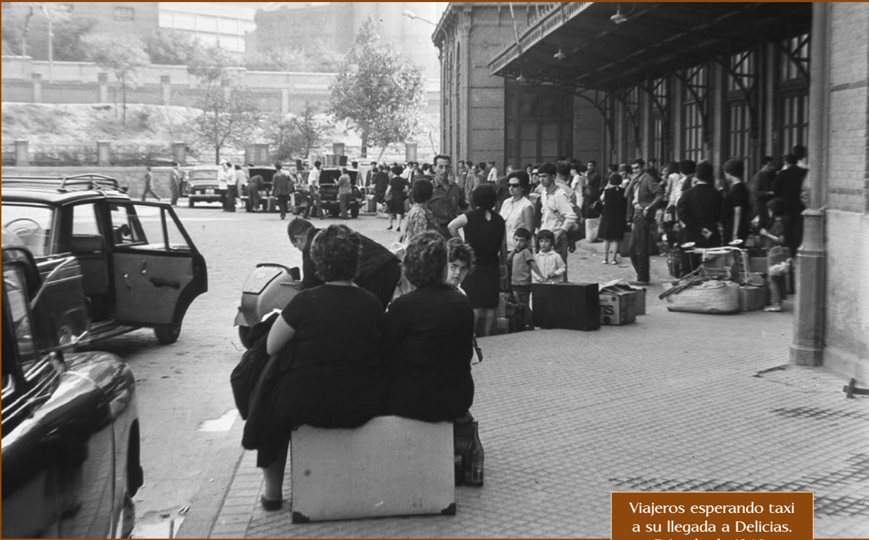
Viajeros esperando taxi a su llegada a Delicias. Década de 1960.

bién se construyó, a comienzos de los años 30, una nueva rotonda para veinticuatro locomotoras.