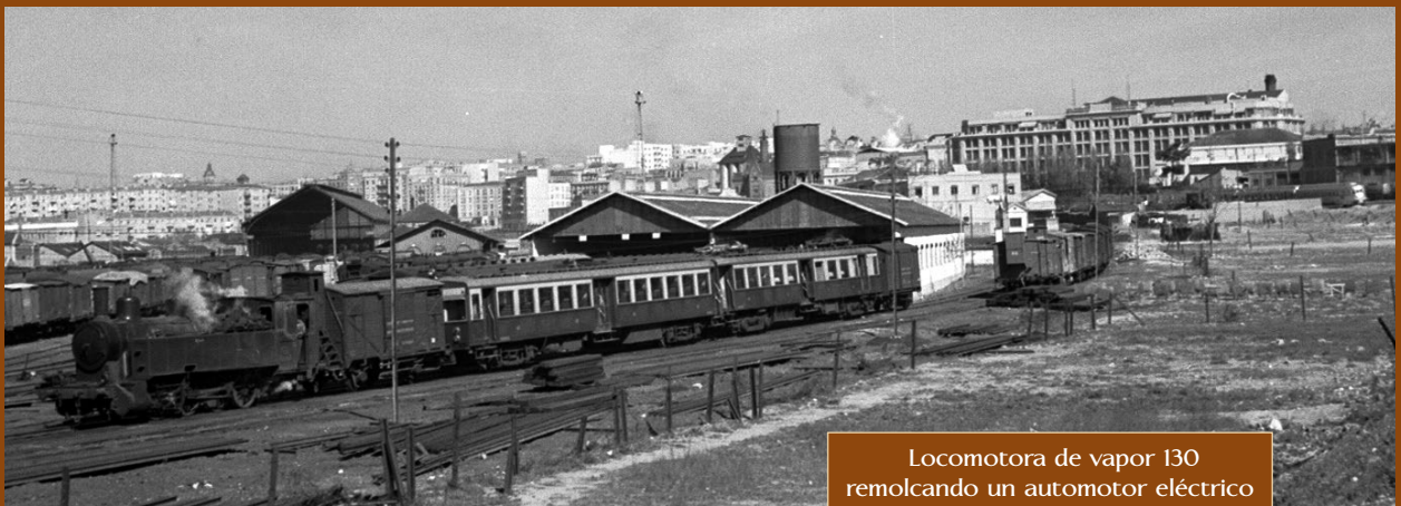
Locomotora de vapor 130 remolcando un automotor eléctrico 433 "pingüino" en Delicias. Año 1957.