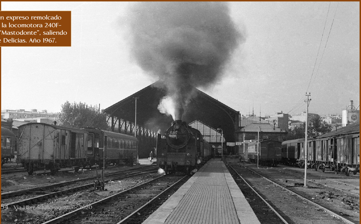
Tren expreso remolcado por la locomotora 240F-2627 "Mastodonte", saliendo de Delicias. Año 1967.