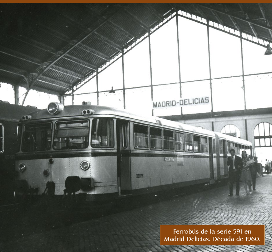
Ferrobús de la serie 591 en Madrid Delicias. Década de 1960.