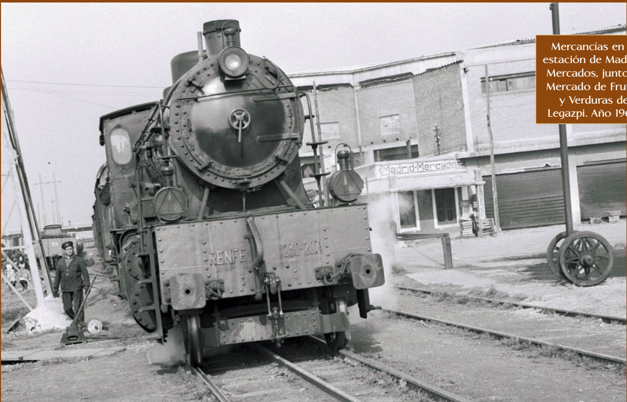
Mercancías en la estación de Madrid-Mercados, junto al Mercado de Frutas y Verduras de Legazpi. Año 1966.

En los años posteriores solo se hicieron obras de adecentamiento del recinto exterior y de algunas dependencias internas, como el ves-