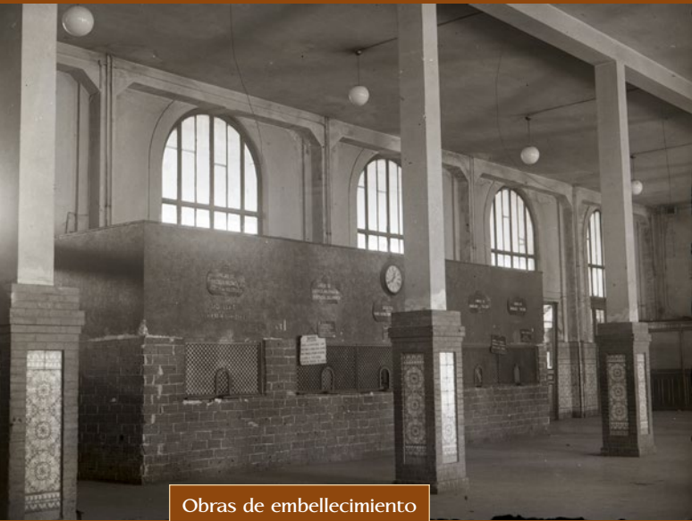
Obras de embellecimiento del vestíbulo. Año 1954.